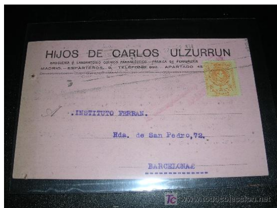
Sobre de los Laboratorios Hijos de Carlos Ulzurún

Con el tiempo establecieron en Lisboa una filial del laboratorio, donde se preparaban los mismos productos que en España.