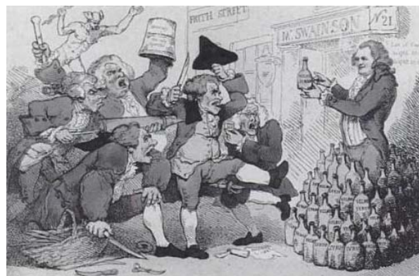
Imagen de época de charlatanes y curanderos ingleses que compiten con remedios secretos para curar las enfermedades venéreas, unos ofrecen productos vegetales y otros mercuriales

Con el nombre de Jarabe antivenéreo de John Burrows se conoce un remedio secreto medicina hecha a base de plantas suaves purgantes, con propiedades antivenéreas y anti-escorbúticas.